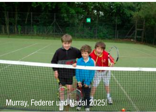
Murray, Federer und Nadal 2025!