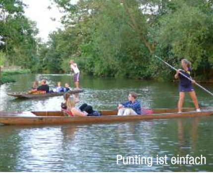
Punting ist einfach