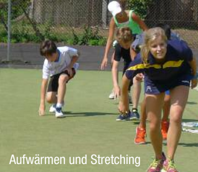
Aufwärmen und Stretching