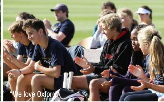
"We love Oxford"