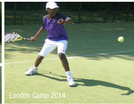
London Camp 2014