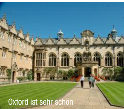
Oxford ist sehr schön