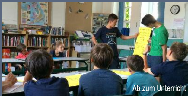
Ab zum Unterricht