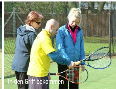
In den Griff bekommen