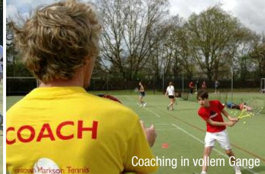
Coaching in vollem Gange